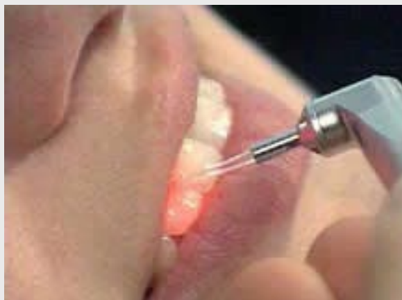
Laser-Parodontalbehandlung Schmerzlos und effektiv

Dank des Lasers können wir auch bei fortgeschrittener Parodontitis häufig auf Operationen verzichten. Statt dessen führen wir eine schonende geschlossene Curettage der Taschen mit Laserdekontamination und evtl. begleitender Antibiotikagabe durch. In vielen Fällen kommt es dadurch zur Ausheilung der Entzündung.