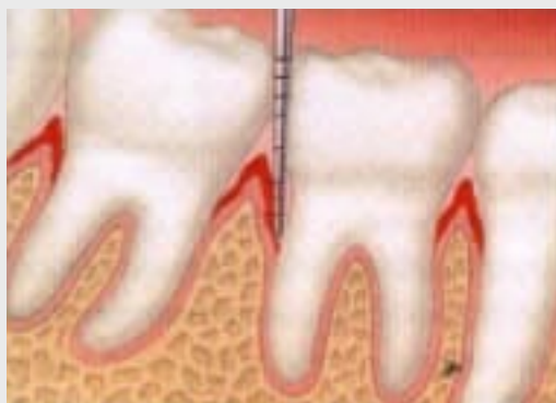
Messung der Zahnfleischtaschen oben: gesundes Zahnfleisch unten: Taschenbildung