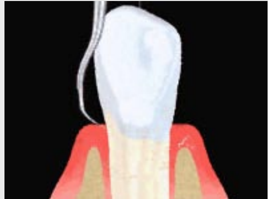
Ausschaben der Zahnfleischtaschen

Bei der folgenden Kontrollsituation nach 1-3 Monaten werden erneut die Taschentiefen gemessen und das weitere therapeutische Vorgehen geplant. Wenn weiterhin tiefe Taschen festgestellt werden, besteht der nächste Behandlungsschritt meist im sogenannten „Deep Scaling“, d.h. ein gründliches Ausschaben der unter dem Zahnfleischniveau gelegenen Taschen und Wurzeloberflächen. Diese Maßnahme wird ebenfalls von der Dentalhygienikerin in örtlicher Betäubung durchgeführt und ist somit schmerzfrei.