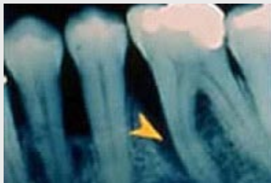
Fortgeschrittene Parodontitis mit tiefer Knochentasche