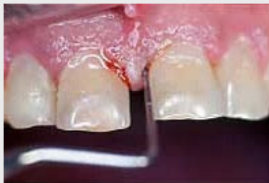
Gingivitis mit Taschenbildung und ausgeprägter Blutungsneigung